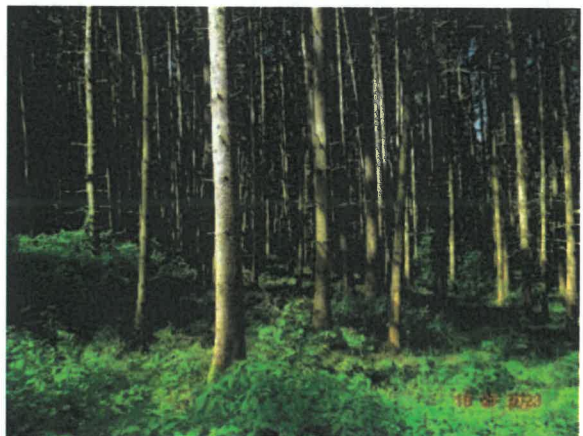
Bildausschnitt der Fläche D

Die Umbauwürdigkeit des Ausgangsbestandes ist gegeben: