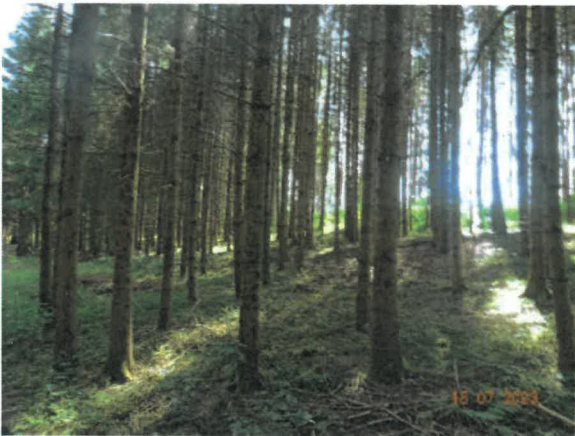
Bildausschnitt der Fläche C