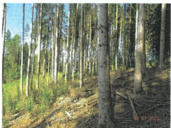
östlicher Teil der Maßnahmenfläche