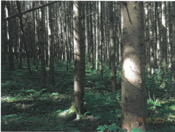
Bildausschnitt der Fläche A