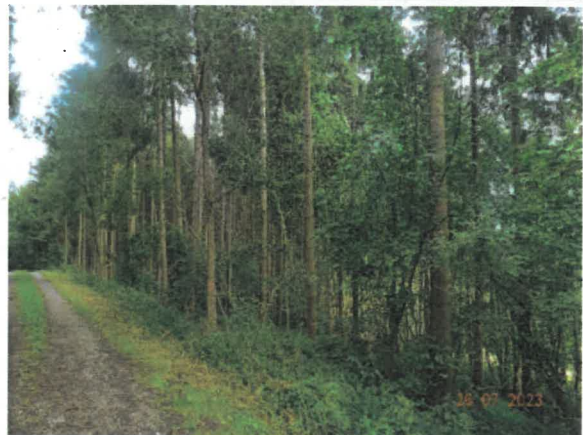
Bildausschnitt der Fläche B