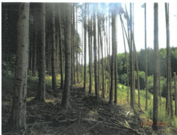
Westlicher Teil der Maßnahmenfläche

Die aufgeführten Pflanzen bilden das charakteristische Artenspektrum ab. Ein Anspruch auf Vollständigkeit ist nicht gegeben.