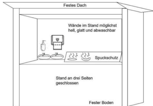
Abbildung 1: Schematische Darstellung eines geeigneten Lebensmittelverkaufsstandes